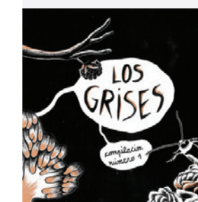
— Los Grises